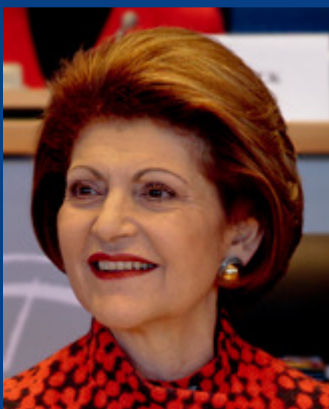
Kommissarin A. Vassiliou

Quelle: EU-Nachrichten, Themenheft Nr. 30, S.4-5